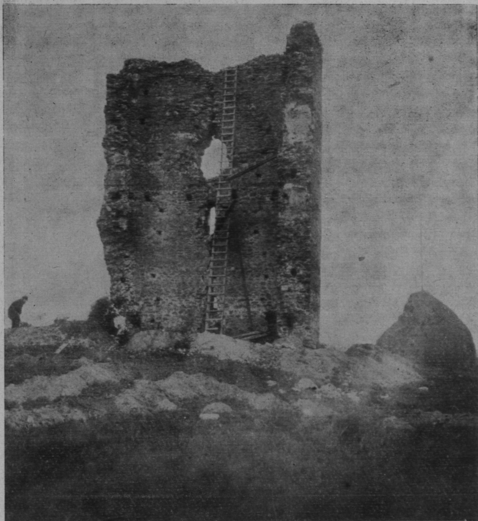
Рис. 2. Руины башни в Белавине.

широких археологических работ вокруг них, не дают никаких данных об организации обороны всего комплекса сооружений, с которым эти башни были связаны. Возможно, что некоторые башни вообще стояли обособленно, не входя в состав какой-либо более сложной оборонительной системы. Но,