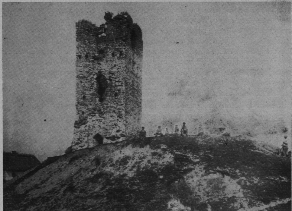
Рис. 1. Башня в Столпье. Фот. 1909 г. из Фотоархива Иист. археологии АИ СССР.

бывахуь бо со столпа того" 6 . Таким образом, судя по летописи, башня находилась где-то перед городскими воротами. Вряд ли она была расположена буквально перед самыми воротами, вероятно она лишь защищала подход к этим воротам и только в этом смысле стояла "перед вороты города". Наиболее правдоподобно, что каменная башня стояла несколько севернее ворот, там где изображена башня на гравюре, изображающей Гродно в XVI веке 7 . Во всяком случае, несомненно, что башня находилась на напольной стороне