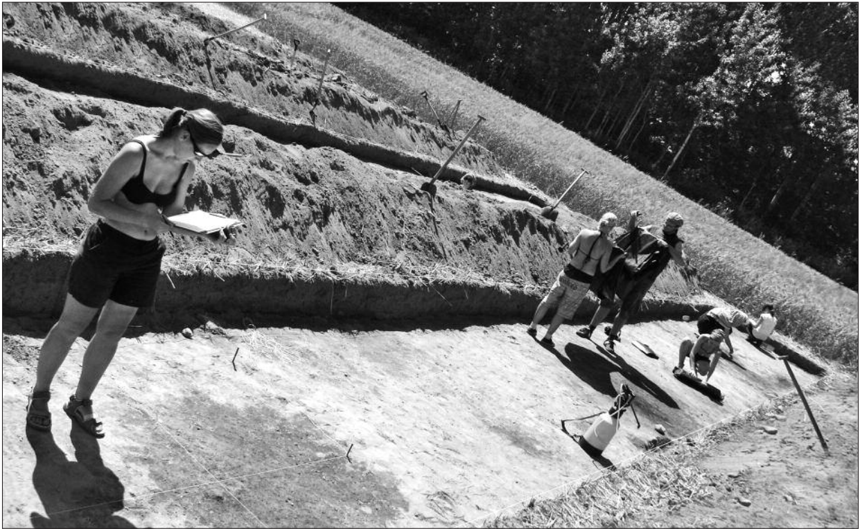
Ryc. 1. Dokumentacja obiektów na stanowisku.