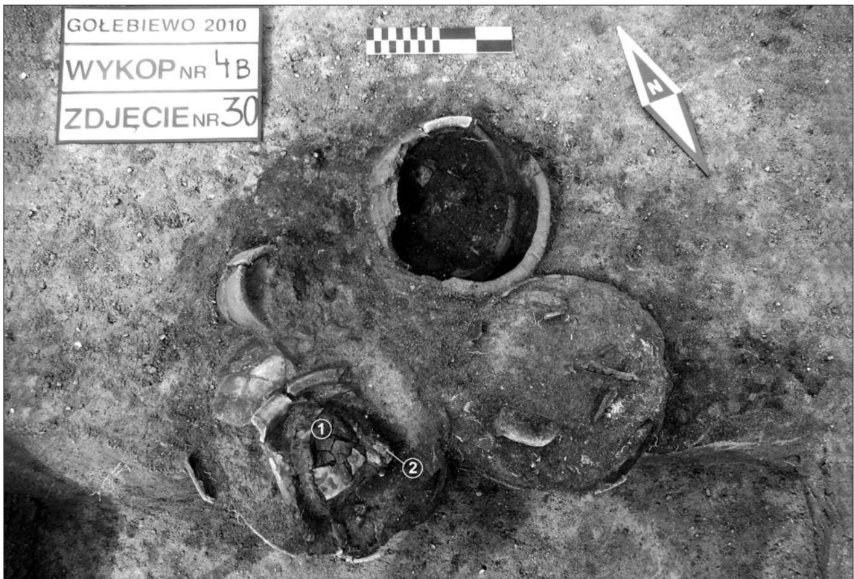
Ryc. 2. Obiekt 23/2010 (grób popielnicowy). W jednej z popielnic widoczne spękane umbo (1) oraz grot (2).