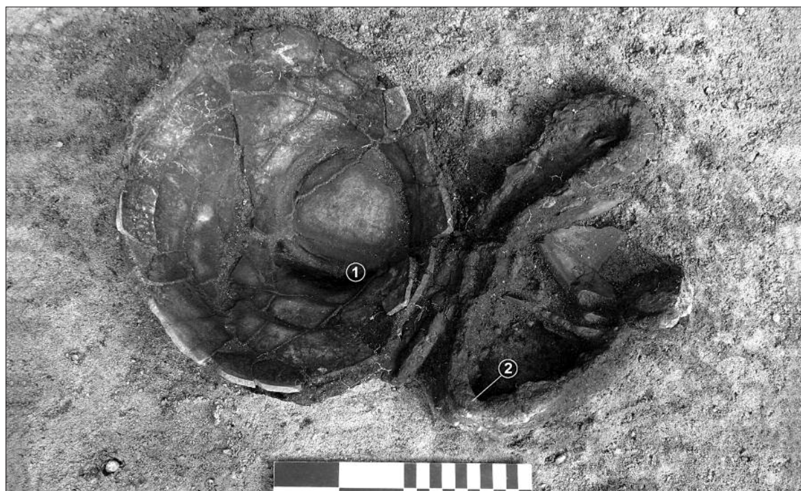
Ryc. 3. Obiekt 24/2010 (grób popielnicowy). Naczynie (1), w które wstawiona była mniejsza popielnica; obok, odsłonięty na dnie jamy, esowato zgięty miecz (2).