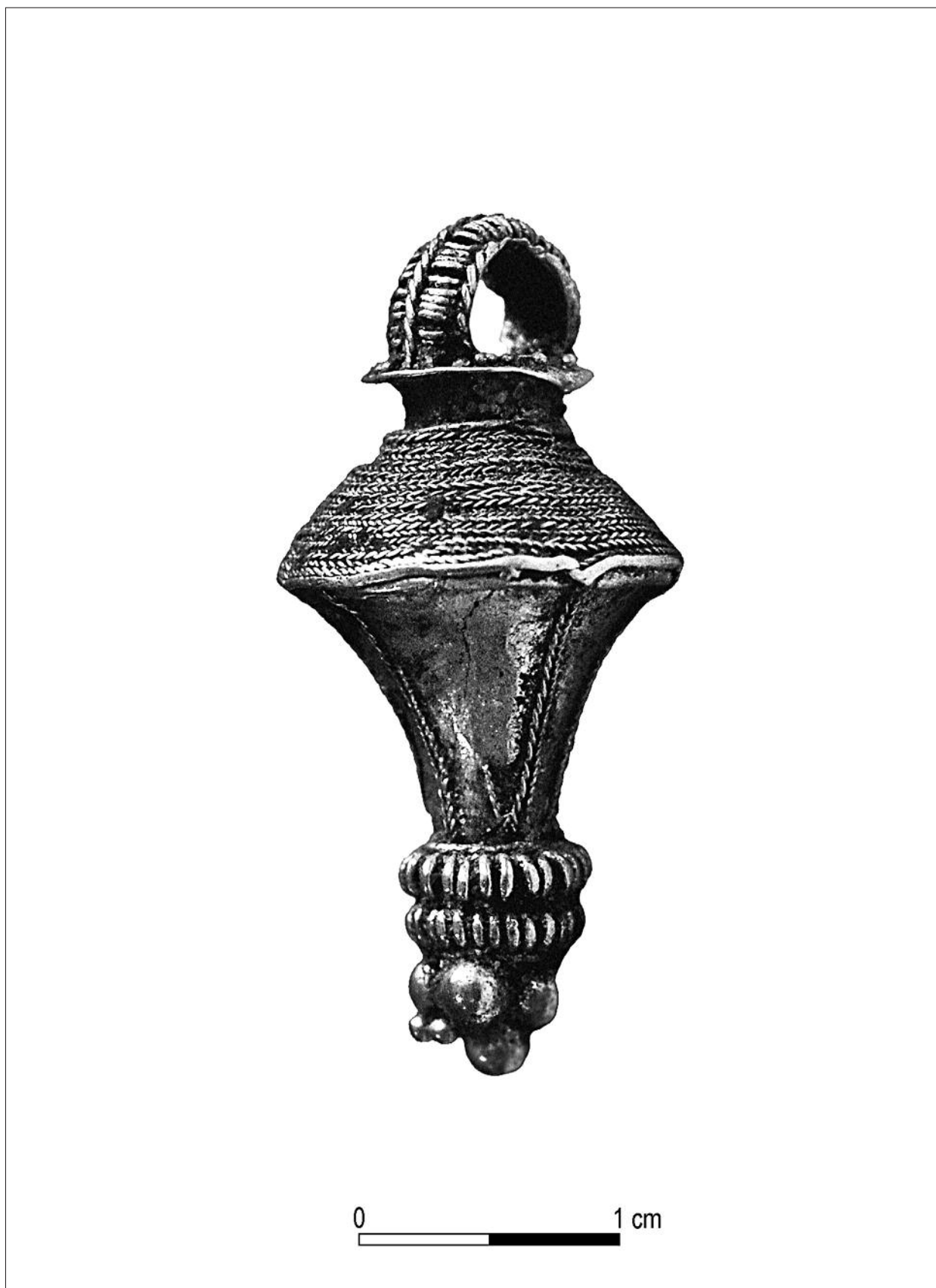
Ryc. 3. Nowy Łowicz. Złoty wisiorek gruszkowaty z grobu 2 w kurhanie 5.