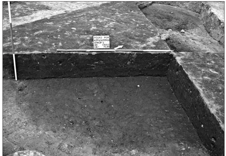
Ryc. 3. Pólko. Obiekt 1 – konstrukcja mieszkalna kultury przeworskiej z wczesnego okresu wpływów rzymskich – w trakcie eksploracji.