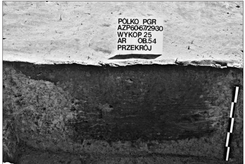
Ryc. 2. Pólko. Jama gospodarcza kultury lużyckiej.