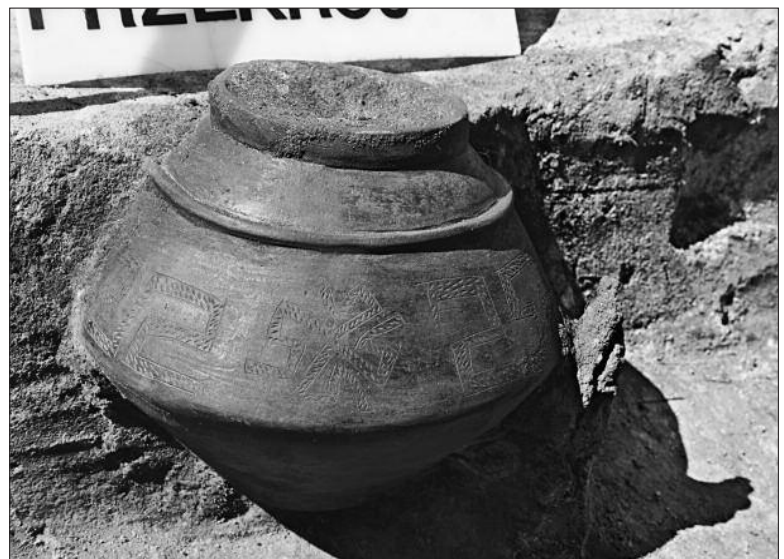
Ryc. 4. Pólko. Obiekt 141 – ciałopalny grób popielnicowy kultury przeworskiej z okresu wpływów rzymskich.