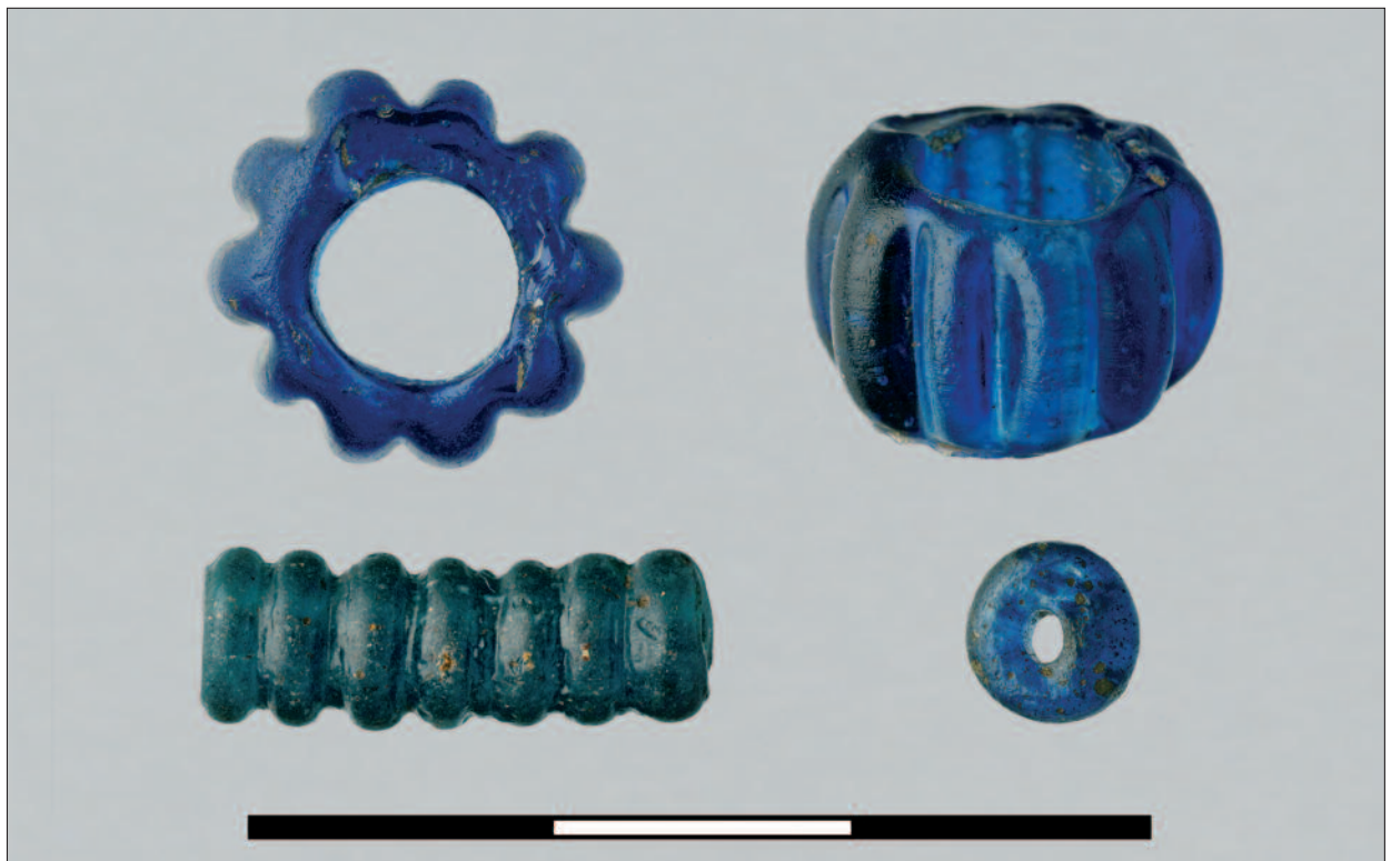
Ryc. 2. Truszkach-Zalesie, st. 4 – osada „Nikienki”. Paciorki szklane (fot. M. Bogacki, M. Dąbski).